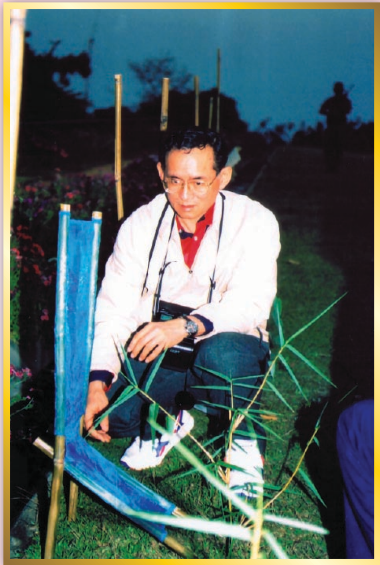
เรียนรู้เศรษฐกิจพอเพียง