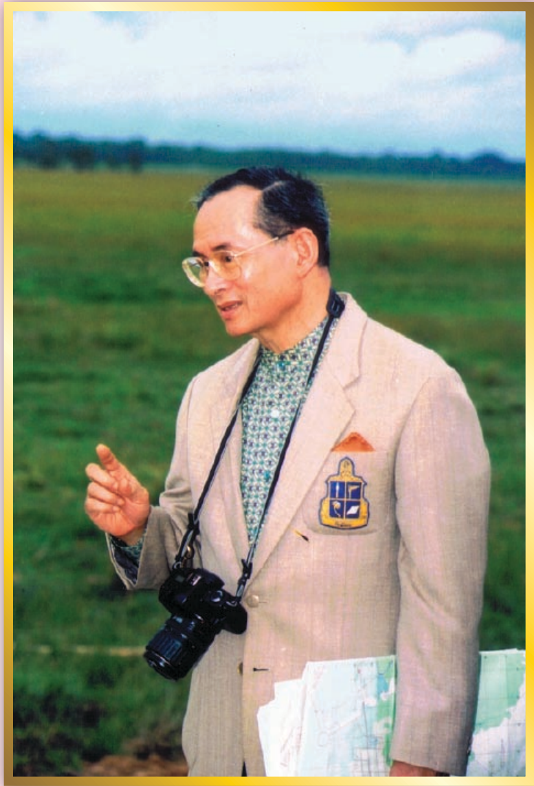
เรียนรู้อุสรากรูทิกงพอเพียง