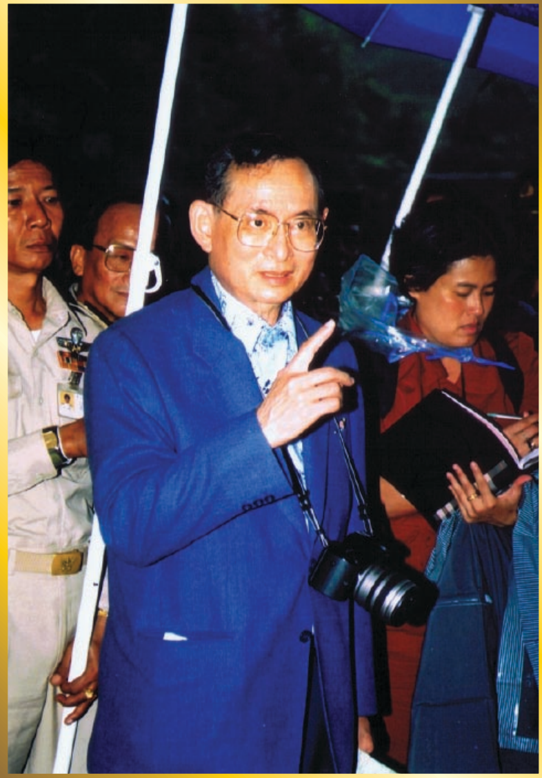
เรียนรู้เศรษฐกิจพอเพียง