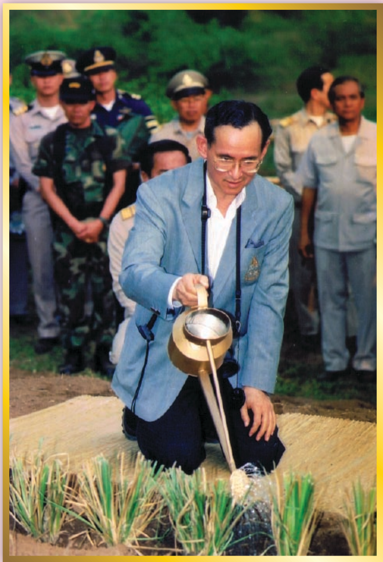
เรียนรู้อะไรจากภาพนี้