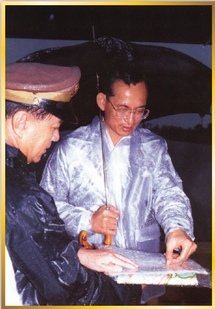
เรียนรู้เศรษฐกิจพอเพียง