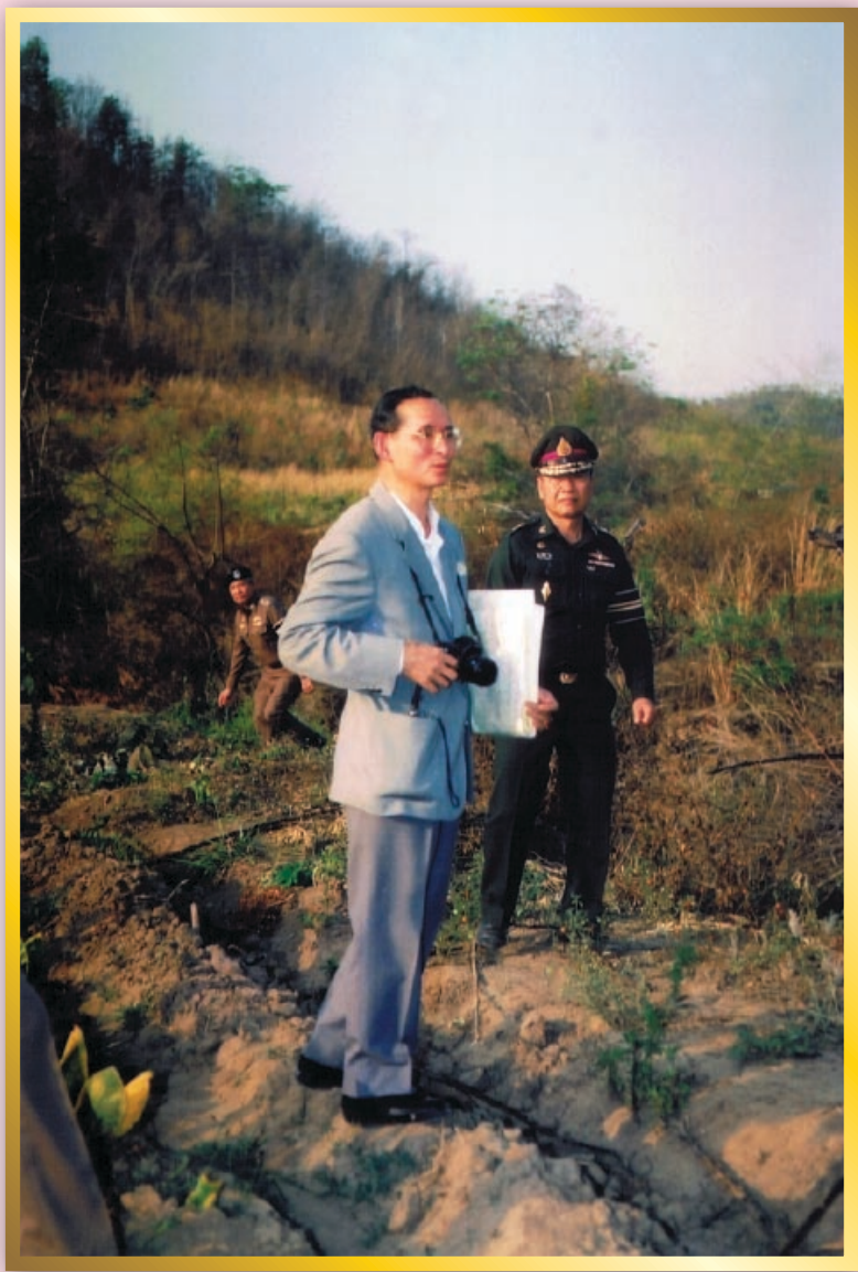
เรียนรู้เศรษฐกิจพอเพียง