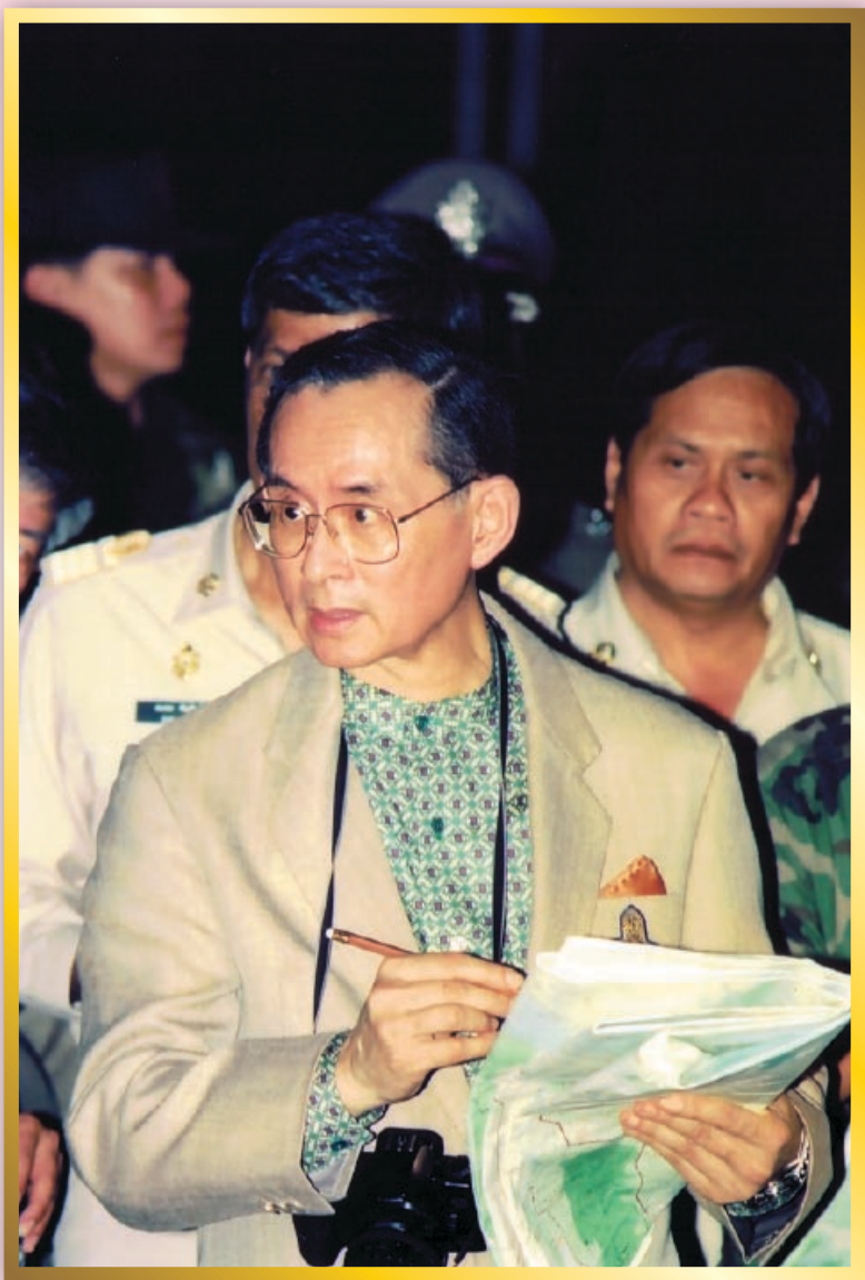
เรียนรู้เศรษฐกิจพอเพียง