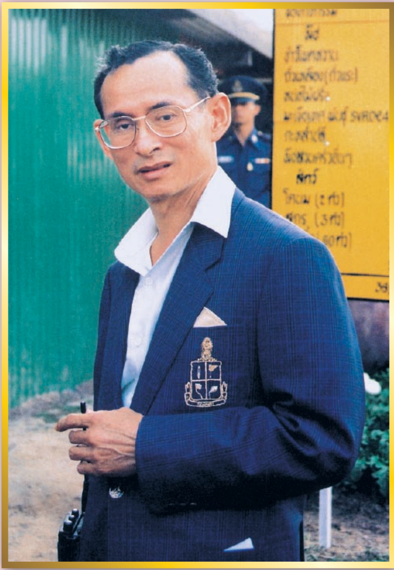
เรียนรู้เศรษฐกิจพอเพียง