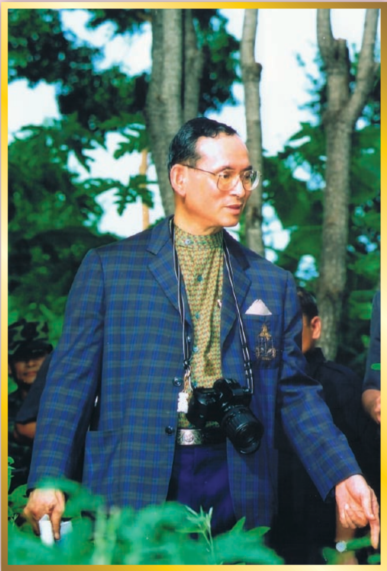
เรียนรู้เศรษฐกิจพอเพียง